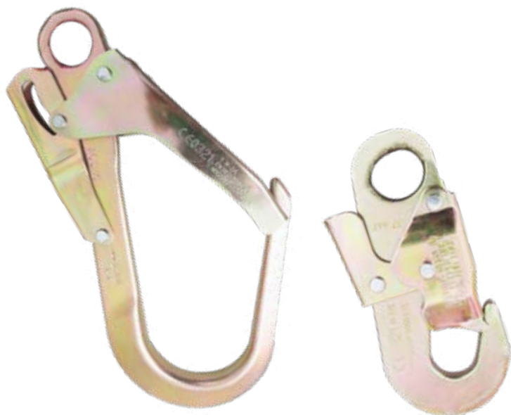
Apertura: 60 mm Dimensión: 22 cm x 11 cm x 1,6 cm